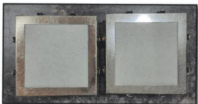
(시험체 설치 모습)